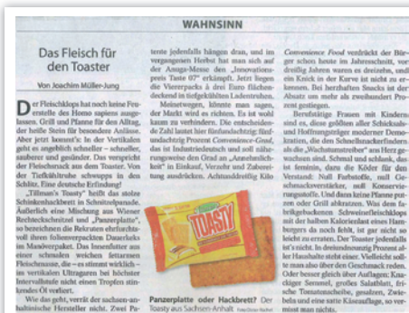
Frankfurter Allgemeine Zeitung