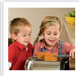
Bildmaterial für Publikumsmedien

Tillman's ist eine Handelsmarke der Unternehmensgruppe TönniesFleisch. Nach der Gründung im Jahr 1999 entwickelte sich Tillman's rasch zum deutschen Marktführer für „Frisches SB-Fleisch“ und „Fleisch Convenience Produkte“. Das Unternehmen beschäftigt rund 1.000 Mitarbeiter an den beiden Produktionsstätten in Weissenfels (Sachsen-Anhalt) und Rheda-Wiedenbrück (Nordrhein-Westfalen).