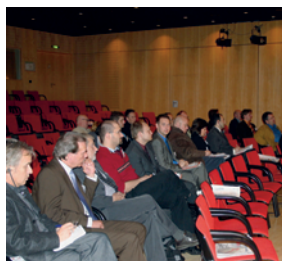
Teilnehmer der Internationalen Pressereise