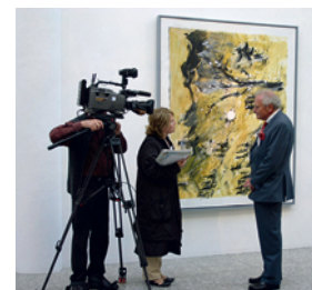
Interview mit einem französischen Fernsehsender in der Unternehmenszentrale in Künzelsau

Die Würth-Gruppe ist Weltmarktführer im Handel mit Befestigungs- und Montagmaterial. Der Aufbau des Unternehmens zählt zu den Erfolgsgeschichten der deutschen Wirtschaftsgeschichte. Aus dem 1954 vom Vater übernommenen Zweimannbetrieb entwickelte Prof. Dr. h.c. Reinhold Würth einen erfolgreichen, weltweit tätigen Handelskonzern mit heute 386 Gesellschaften in 86 Ländern und über 60.000 Mitarbeitern.