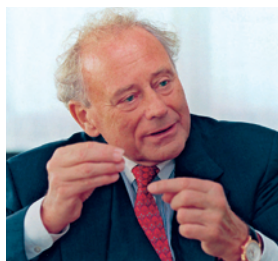
Prof. Dr. h.c. Reinhold Würth